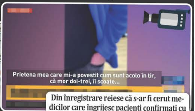
Prietena mea care mi-a povestit cum sunt acolo în tir, că mor doi-trei, îi scoate...

Din înregistrare reiese că s-ar fi cerut medicilor care îngrijesc pacienți confirmați cu COVID-19, să nu mai resusciteze bolnavii care intră în stop cardio-respirator.